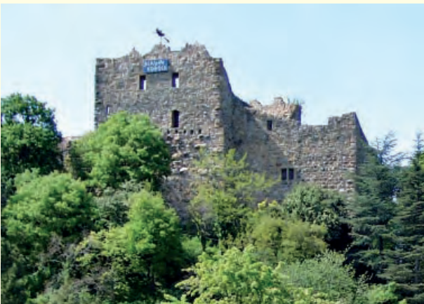
Blick zur Burg

Zum Bau der Burg – der erhaltene Kern stammt noch aus dem frühen 12. Jahrhundert – wurde Material aus der römischen Thermenanlage verwendet. Man nahm deshalb lange an, die Burg selbst sei ebenfalls römischen Ursprungs. Ihr dominantester und ältester Bereich ist der sehr gut erhaltene Palas mit spätromanischen Fensterbögen.