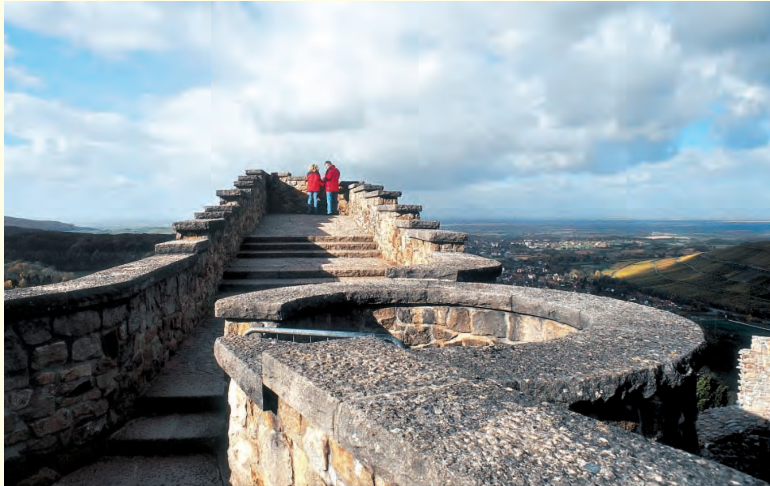
Begehbare Burgmauer mit Blick auf das Markgräflerland

Der Burghof, der Burg vorgelagert, wird von einer starken Schildmauer und mehreren Zwingern umgeben. Die äußeren Zwingernmauern und die Vorburgmauern wurden vermutlich im späten Mittelalter