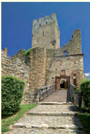
Hauptzugang zur Oberburg

Erhalten hat sich von der weitläufigen, aus Vorburg und Oberburg bestehenden Anlage u.a. der Bergfried, der so genannte „Grüne Turm“, sowie der als „Giller“ bezeichnete Torturm.