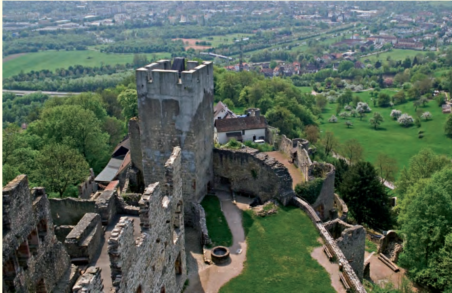
Blick vom Bergfried auf den „Giller“ und den Palas

Im Dreißigjährigen Krieg wurde die Burganlage teilweise zerstört, und die Eroberungskriege im Zuge der Reunionspolitik des Sonnenkönigs, Ludwigs XIV., ließen sie gänzlich als Ruine zurück.