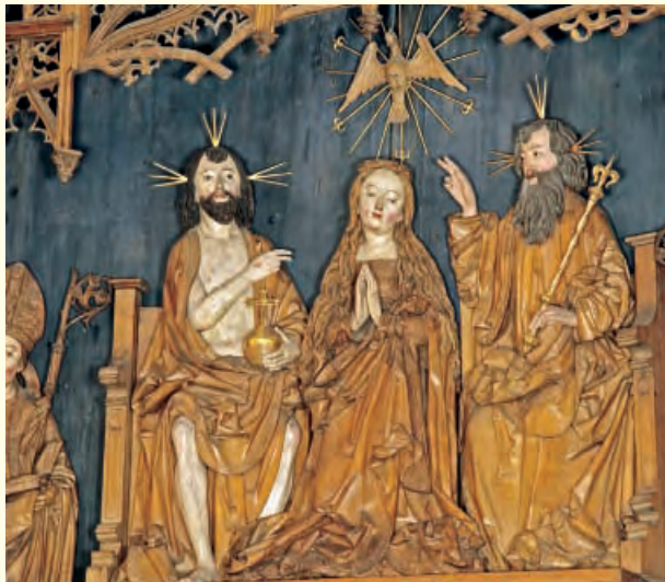
Marienaltar, um 1520/25

Die dreischiffige romanische Säulenbasilika besitzt einen kreuzförmigen Grundriss. Im Kirchenraum setzt sich die Herbheit und Strenge des Außenbaus fort. Südlich schließen sich an die Kirche die Klausurgebäude an. Der spätgotische Kreuzgang wurde im 15. Jahrhundert umgebaut und ist heute stimmungsvoller Rahmen für die Kreuzgangkonzerte.