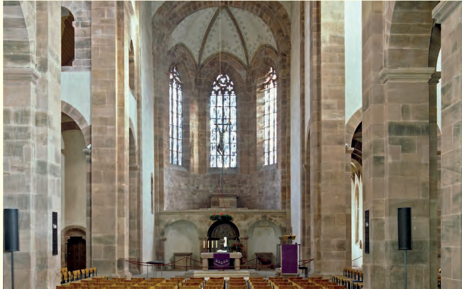
Das Innere der Klosterkirche

Die Benediktinermönche hatten das Kloster zu Wohlstand geführt. Nach der Reformation wurde 1556 der Konvent aufgehoben und eine evangelische Klosterschule eingerichtet. Aus dieser Zeit stammt ein sensationeller Fund von Schuhen, Kleidungsstücken, Briefen und