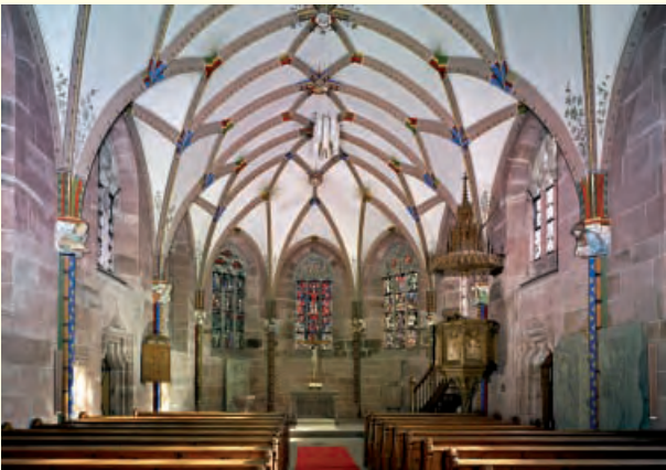
Chor der Marienkapelle

Nach der Reformation und Einrichtung einer protestantischen Klosterschule wurde die Klosteranlage durch das herzogliche Jagd- schloss ergänzt. Nach einem Brand Ende des 17. Jahrhunderts und