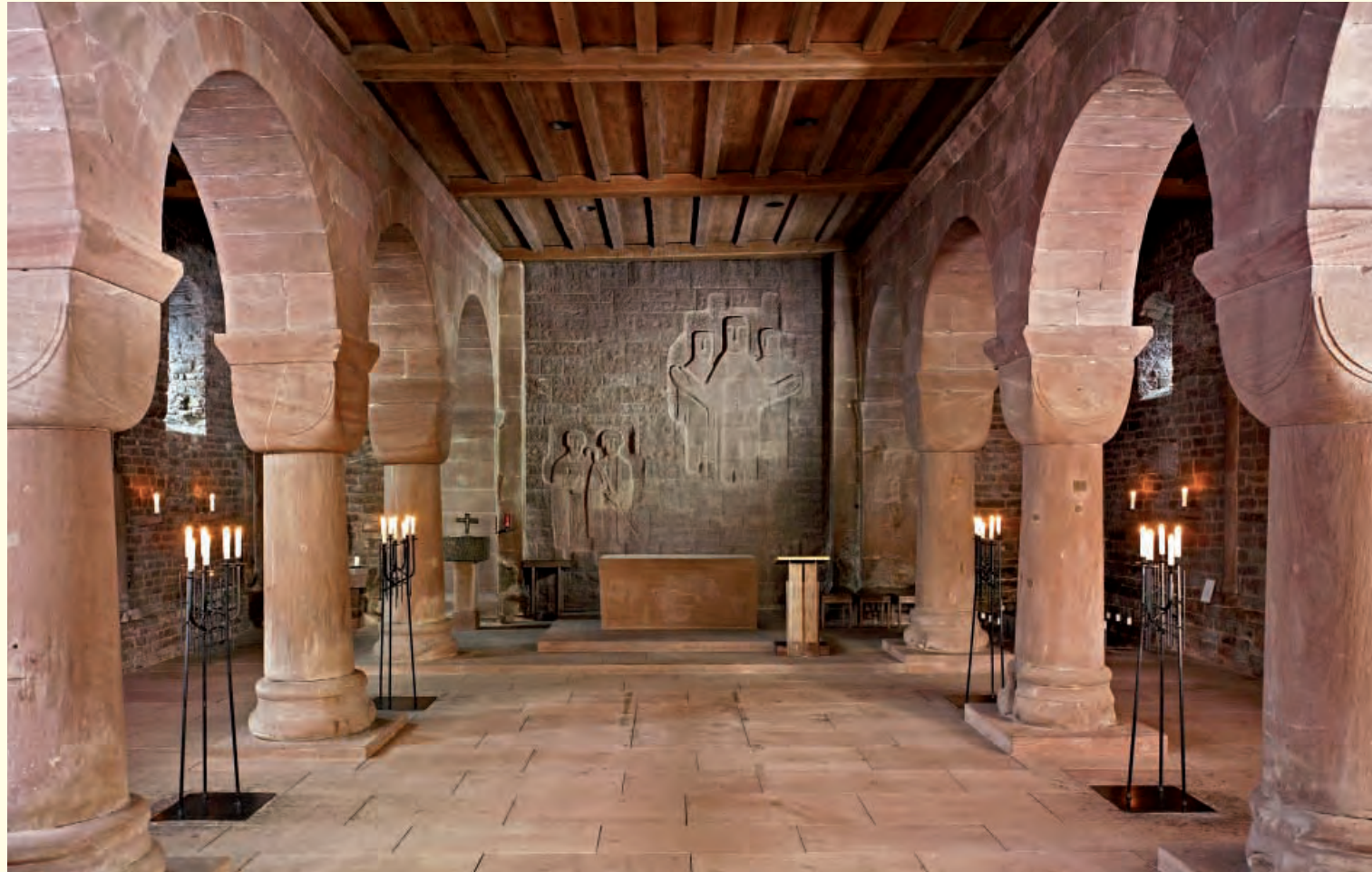
Mittelschiff der Aureliuskirche

Das benachbarte, 1091 geweihte Kloster St. Peter und Paul war zu seiner Zeit eines der größten Klöster Europas. Die nach dem Bauplan benediktinischer Reformklöster errichtete Kirche war Vorbild für viele nachfolgende Gründungen. Die Klausur wurde Ende des 15. Jahrhunderts in gotischer Formensprache erneuert.