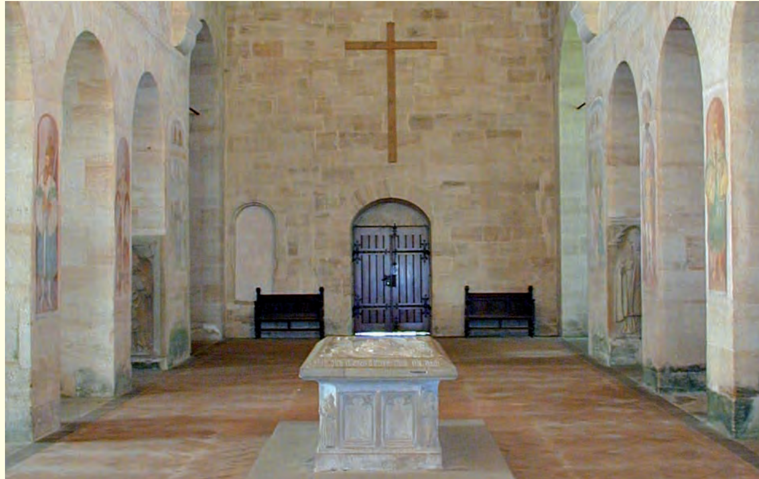
Blick in das Kirchenschiff nach Westen

Zur 900-Jahr-Feier der Klostergründung 2002 entstand im Kapitelsaal ein großes Staufer-Rundbild des Lorcher Malers Hans Kloss. Bunt, lebendig und mit Humor gewürzt wird darin die Geschichte des legendären Fürstengeschlechts erzählt.