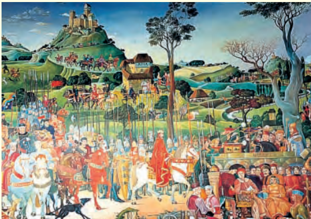
Ausschnitt aus dem Stauferrundbild

Im 19. Jahrhundert entdeckte man Lorch als mittelalterliches Denkmal neu: Für viele Dichter und Künstler, Reisende und Kurgäste wurde das Kloster zu einer Staufergedenkstätte, deren Faszination bis heute anhält.