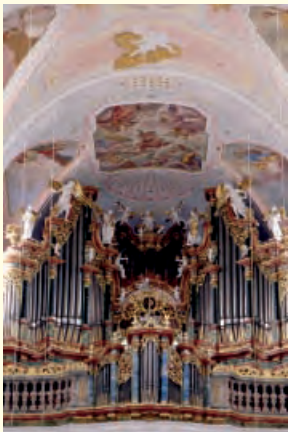
Orgel von Joseph Gabler, 1728-1755

Nach dem Bauernkrieg im 16. Jahrhundert entfaltete das Kloster zu Beginn des 17. Jahrhunderts in der Gegenreformation noch einmal seine alte Kraft. Wieder wurde erweitert und erneuert. Zu Beginn des 18. Jahrhunderts erhielt das Ensemble barocke Formen, die heute noch dominieren. Die Fresken im Kircheninnern von Johann Georg Bergmüller und die Orgel von Joseph Gabler stammen aus dieser Zeit der Umgestaltung, ebenso die Sternwarte im südlichen Eckturm des östlichen Konventflügels.