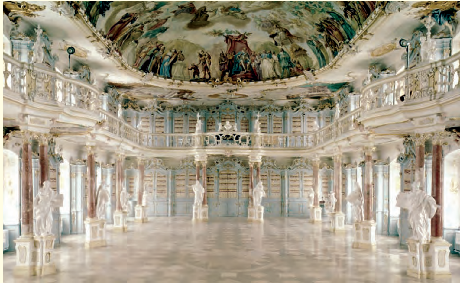
Blick in den Bibliothekssaal