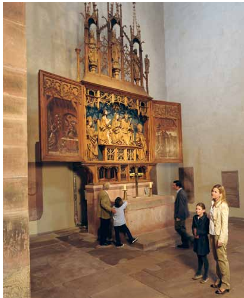
Spätgotisches Meisterwerk in der Klosterkirche: der Marienaltar mit seinem feinen Schnitzwerk

gegliederte Säulenbasilika in Form eines Kreuzes. Das Tympanon über dem Portal der Klosterkirche ist ein herausragendes Zeugnis romanischer Bauplastik aus dem 12. Jahrhundert. Zwei meisterlich gearbeitete Bronze-Türzieher in Form stilisierter Löwenköpfe zieren die Portalflügel. Einzigartig ist auch die zweigeschossige Choranlage der Klosterkirche.