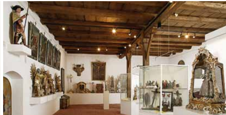
⌄ Frommes Brauchtum und kostbare Handarbeiten der Klosterbewohnerinnen zeigt das Museum in der Bruderkirche

Ein besonderes Glanzstück ist das Chorfenster mit seinen farbenprächtigen Glasmalereien , das um 1312 entstand. Das bekannteste Ausstattungsstück ist die in der Apsis aufgestellte Johannesminne, eine Holzplastik eines Konstanzer Künstlers aus der 1. Hälfte des 14. Jahrhunderts – in süddeutschen Frauenklöstern ein beliebtes Andachtsbild. Das Museum in der Bruderkirche präsentiert viele weitere Besonderheiten sakraler Kunst, eine einmalige Sammlung von „Katakombenheiligen“ sowie Glaubenszeugnissen und Klosterarbeiten der frommen Frauen, die hier bis zum Jahre 1843 ihr Ordensleben führten.