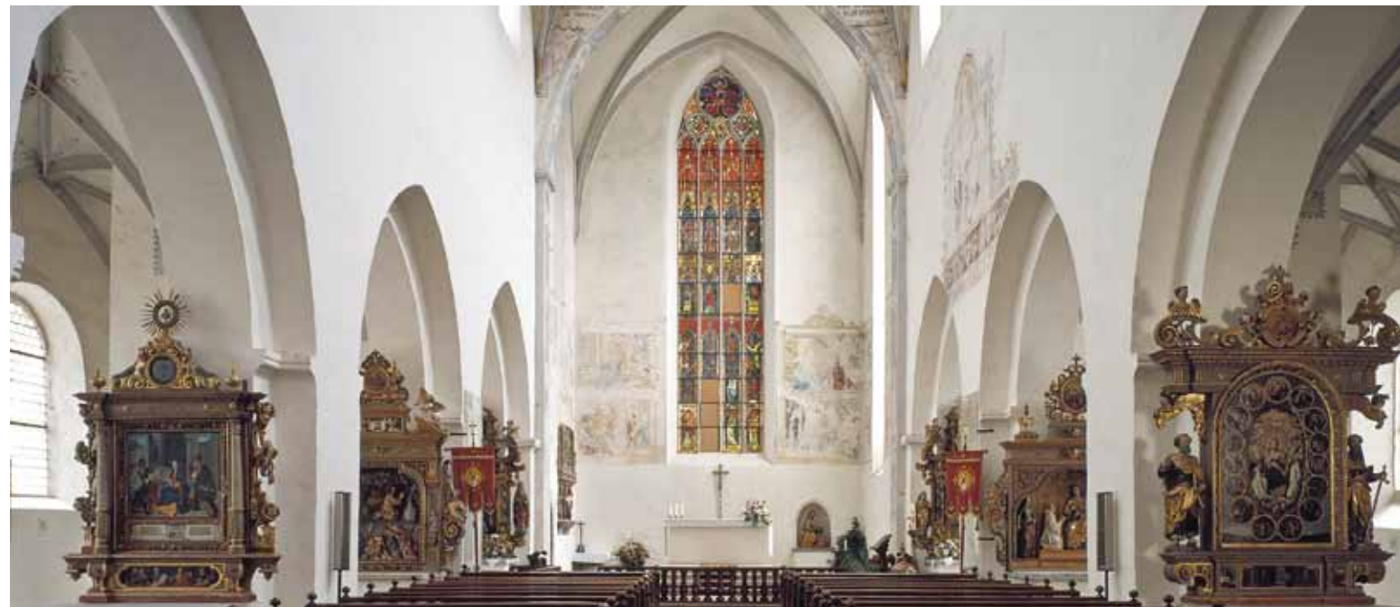
⌄ Blickfang in der Klosterkirche: das leuchtende Chorfenster und der reiche Schmuck der Altäre

von der für Frauenklöster typischen, ebenso schlichten wie eleganten Formensprache der Gotik geprägt. Im Inneren jedoch birgt sie eine sehenswerte Sammlung prachtvoller Altäre aus Renaissance und Barock.