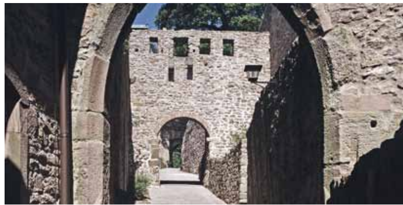
🏰 Zur eigentlichen Burg von Hohenbaden, der Oberburg, führt der Weg durch das gotische Tor der Unterburg