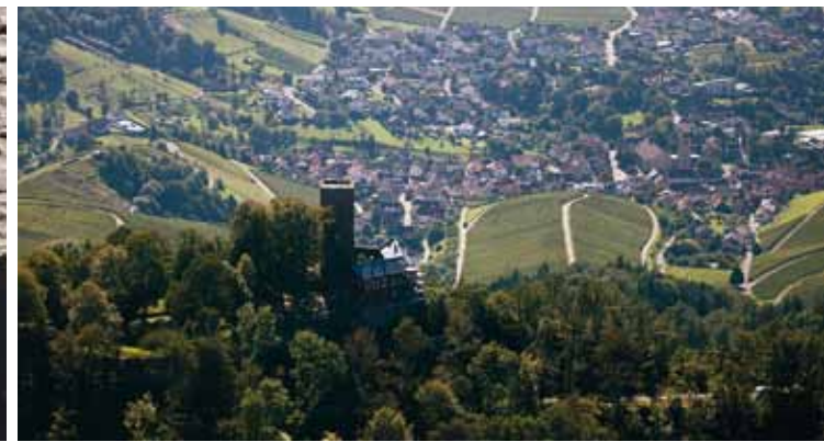
🏰 Die Yburg ist mit ihrer Lage über den Rebhängen ein beliebtes Ausflugsziel