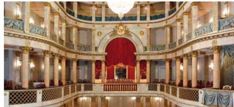
👑 Das älteste Schlosstheater Europas mit originaler Bühnenmaschinerie erlebt man in Ludwigsburg

Ein Fest für die Sinne ist auch die große Parkanlage, die das Schloss auf drei Seiten umschließt. Zur 250-Jahr-Feier des Schlosses 1954 wurden diese Gärten teils in historischer, teils dem Barock frei nachempfunder Form angelegt. Seitdem ist die Gartenanlage mit dem dazugehörigen Märchengarten als „Blühendes Barock“ bekannt und ein beliebtes Ausflugsziel.