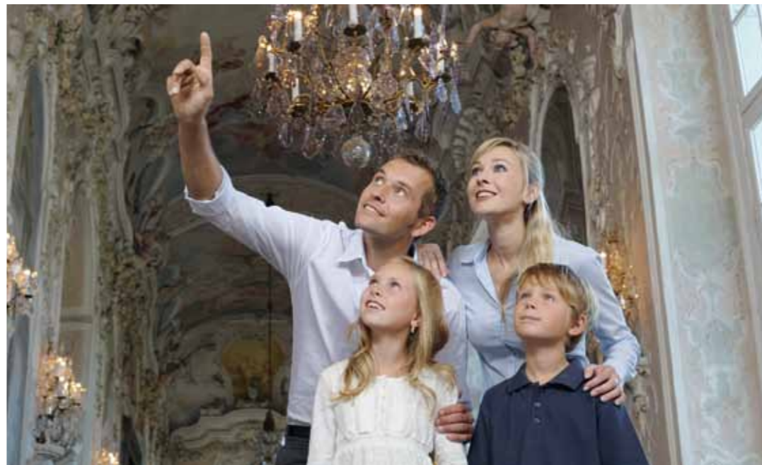
👑 Vom Licht durchflutet, gibt der Marmoraal einen guten Eindruck vom Glanz des württembergischen Königshofs