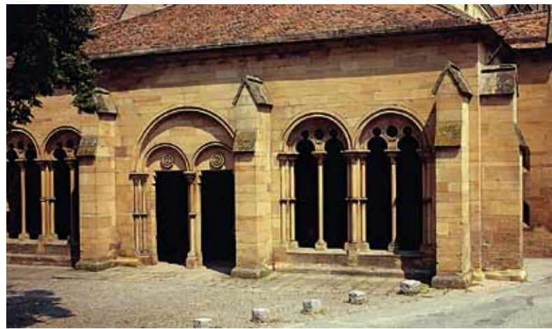
🏰 Die Vorhalle zur Klosterkirche, das „Paradies“, ist ein absolutes Meisterwerk der frühgotischen Architektur

Das „Paradies“ – die Vorhalle der Klosterkirche – erhielt seinen Namen aus der Tradition, den Vorraum der Kirche mit der Geschichte des Sündenfalls auszumalen. Die letzte Bemalung stammt aus dem Jahr 1522, von ihr sind jedoch nur noch geringfügige Reste erhalten. „Paradies“, südlicher Kreuzgangflügel und Herrenrefektorium sind Zeugnisse des spätromanisch-frühgotischen Übergangsstils und von außerordentlicher Wichtigkeit für die Verbreitung der Frühgotik im deutschsprachigen Raum.