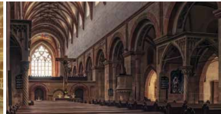
🏰 Romanische Arkadenwand, gotisches Gewölbe: Die Klosterkirche zeigt die Veränderungen in den Epochen und Jahrhunderten

Durch die Ernennung zum Weltkulturerbe ist die Klosteranlage heute weltweit bekannt und zieht zahlreiche internationale Besucher an. Regelmäßig werden Klosterkonzerte veranstaltet, die auch die besondere Akustik der Klosterbauten wunderbar zur Geltung bringen.