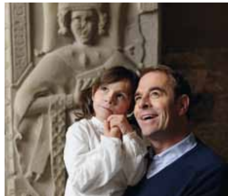
🏰 Die Wucht der romanischen Formsprache prägt die frühesten Gebäudeteile

Nach der Reformation ließ Herzog Christoph von Württemberg 1556 hier eine evangelische Klosterschule einrichten, die als evan-