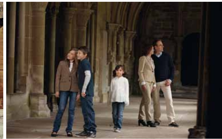
🏰 Auf dieses spätgotische Gewölbe stößt man im Verbindungsbau beim Kreuzgang – überall Feinheiten und Perfektion

gelisch-theologisches Seminar noch heute besteht. Namhafte Größen der Wissenschaft und Literatur wie Johannes Kepler, Friedrich Hölderlin und Hermann Hesse verbrachten hier einen Teil ihrer Schulzeit.