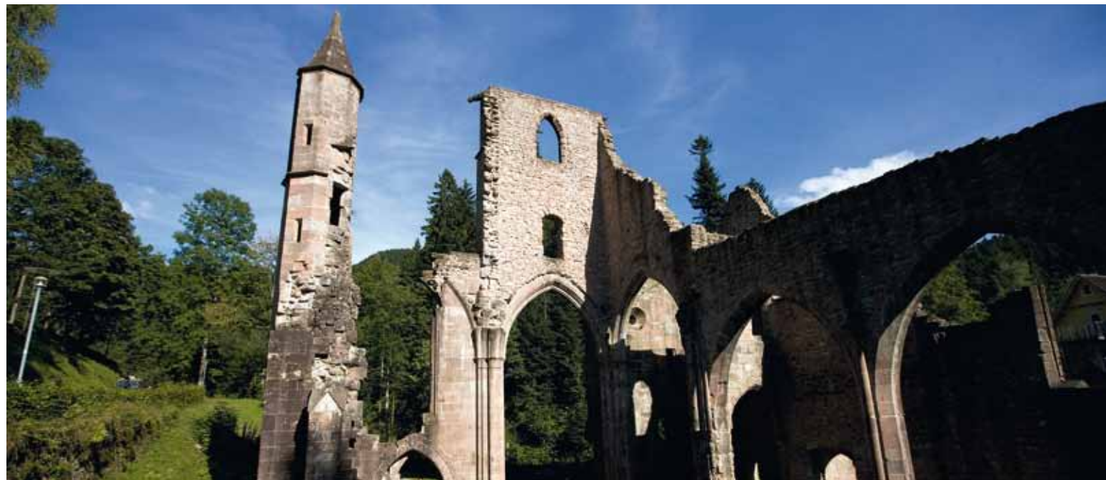
🏰 Grandios einsam liegt das einstige Kloster in einem hochgelegenen Schwarzwaldtal

Die Säkularisierung am Beginn des 19. Jahrhunderts läutete wie vielerorts nicht nur das Ende klösterlichen Lebens ein, sondern auch die Umnutzung und Zerstörung. Nach einem Brand wurden die Gebäude zum Abbruch freigegeben.