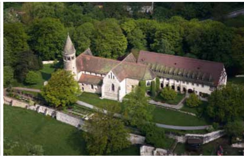
Schon von weitem sieht man die Klosterkirche von Lorch, in bester Aussichtslage auf einem Bergrücken

Der Dokumentationsraum für staufische Geschichte am Fuße des Berges gibt Auskunft über Herkunft, Heimat, Geschehnisse und Erklärung der mächtigen Dynastie.