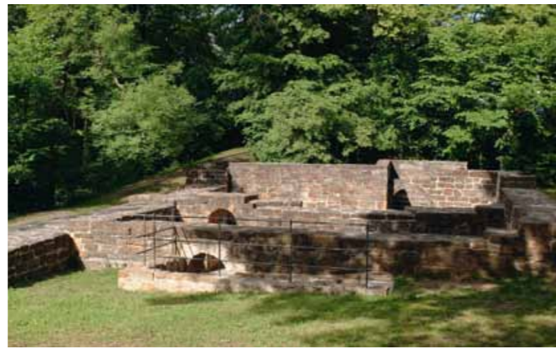
Von der einst bedeutenden Burg auf dem Hohenstaufen sind heute nur noch Grundmauern erhalten

Von der Burg Wäscherschloss über den Hohenstaufen zum Kloster Lorch: wichtige Stationen in der Geschichte der Stauer. Von der Wiege über die Stammburg bis zur ersten Grablege des Herrschergeschlechts.